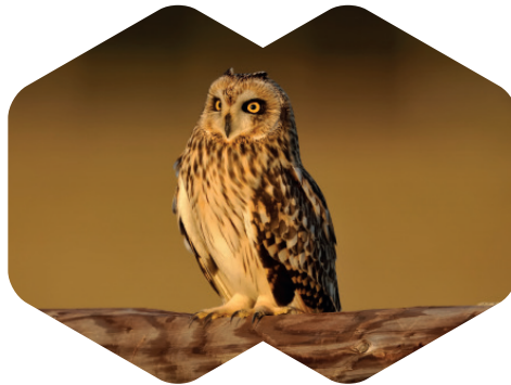
Hibou des marais

Il émet de nombreux sons en «ule» et pendant la saison des amours le cri du mâle ressemble à une locomotive à vapeur: «hoo-hoo!». La femelle lui répond par un «kee-ow». Pour protéger leurs nids, les Hiboux des marais poussent des cris rauques très particuliers: ils sifflent et aboient.